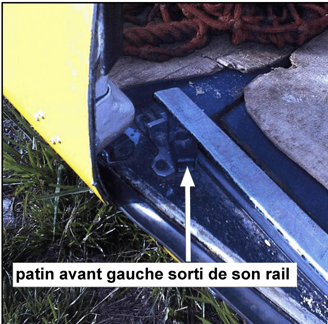
patin avant gauche sorti de son rail