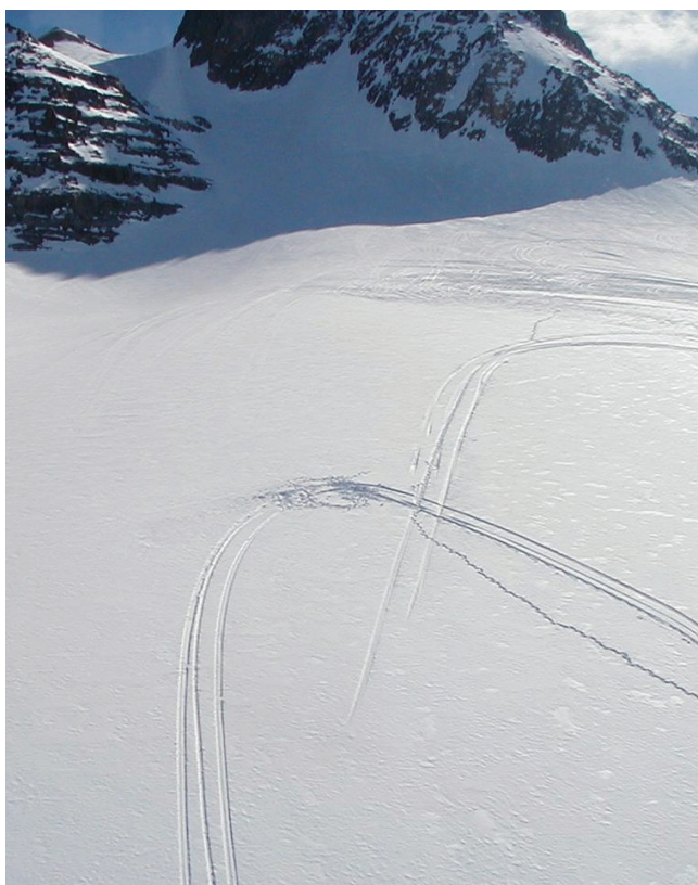
Zone de posé de l'avion

Le site de l'accident se situe sur le glacier de l'Etendard à une altitude de 2 707 mètres. Les coordonnées géographiques sont : N 45° 09' 48,06", E 006° 10' 41,12". La zone enneigée laisse apparaître les traces du premier atterrissage et du premier décollage. Plus bas et à gauche de la première trajectoire, les traces du second atterrissage, le point d'arrêt de l'avion et les traces du décollage au cours duquel s'est produit l'accident sont visibles.