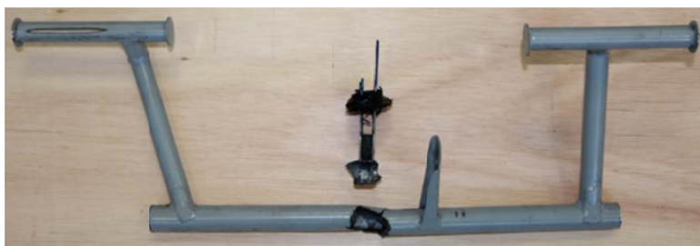
Commande gauche rompue, vue de l'arrière

La commande gauche est rompue en limite du cordon de soudure, au niveau du renvoi vers la gouverne de direction.