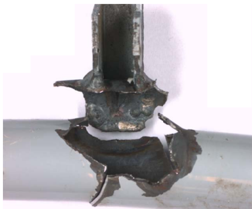
Rupture du renvoi vers la gouverne au niveau du cordon de soudure

Les enquêtes du BEA ont pour unique objectif l'amélioration de la sécurité aérienne et ne visent nullement à la détermination de fautes ou responsabilités.